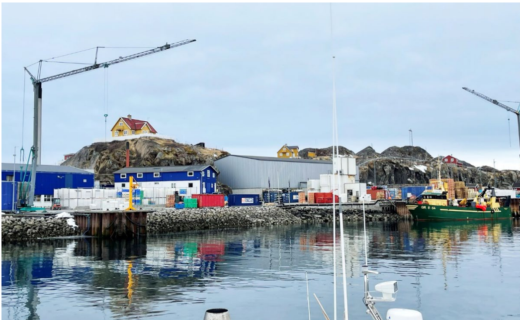
Takussutissiaq 2 / Immikkoortup pilersaarusiortiusup suliffissuaqarfittaani ulapaarfiusumi pissutsit pioreersut.

Fig. 2 og 3 viser foto af områdets eksisterende forhold.