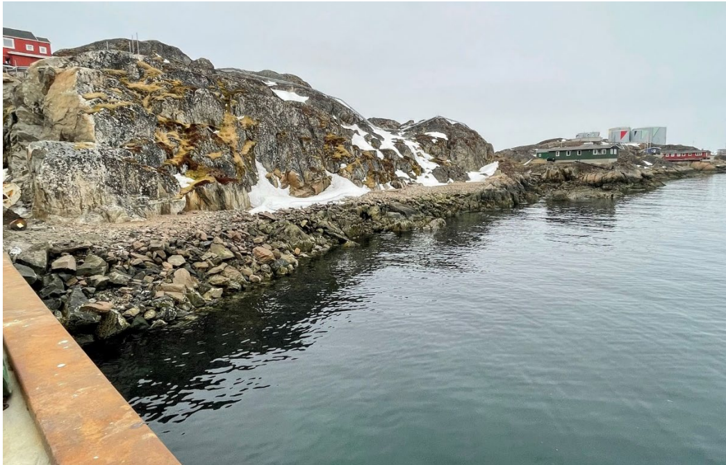
Takussutissiaq 3 / mi asseq immikkoortup pilersaarusiordfigineqarnerani Sallinguit kitaani talittarfiup naanera

Fig. 3 / Foto af eksisterende forhold med planområdets havneafslutning i vest mod Sallinguit.