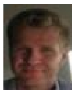
Laust Løgstrup Aningaasaqarnermut, Teknikkimut Avatangisinnullu Pisortaq