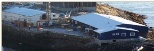
Kangaamiunit tunitsiviullunilu tunisassiorfik.

Piniutitigut ikiuussinnaaneq, ningittakatigut, qarsorsat, amoorutit assigisaallu.