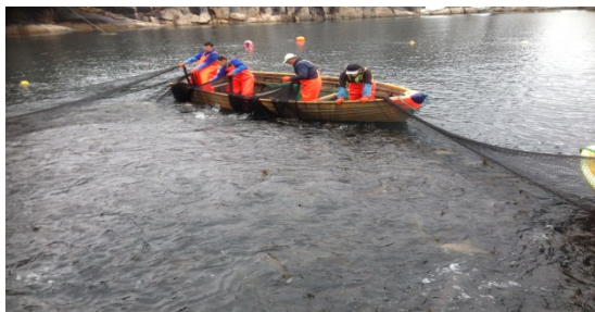
Assiliaq: Bundgarnit amuarneqartut.

*Saarullit uumatillugit bundgarniit Maniitsumi tunisassiorfimmut nuunneqassapput.