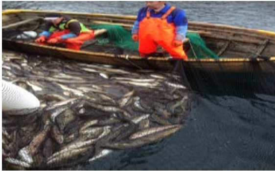
Assiliaq: saarulliit millugullugit umiarsuarmut nuullugit