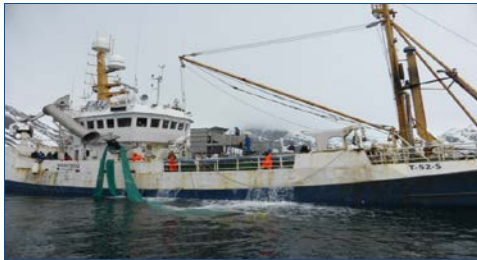
1) miarsuaq bundgarnit pisanik millugussisoq.