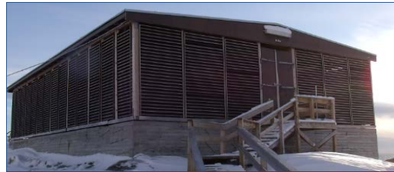
2) Kangaamiuni saarullinnik ukiumi panersiivik.

*Panertitsiveqarput tamakkiisumik atorneqanngitsumik. Suli annertunerusumik atorneqarsinnaagaluarpoq.