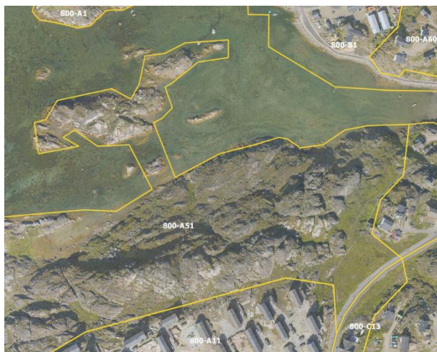
Eksisterende forhold A51)

Med forslag til kommuneplantillæg nr. 64 omdannes den østlige del af delområde A51 til et centerområde C12. Den resterende del af område A51 forbliver udlagt til et boligområde.