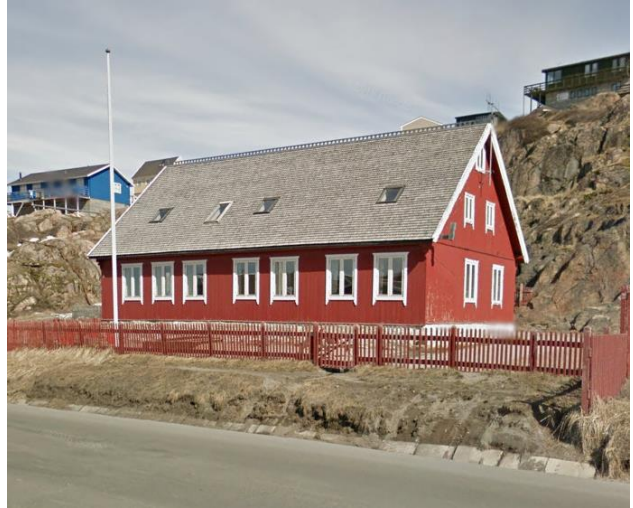
Fig. 2 foto B-17