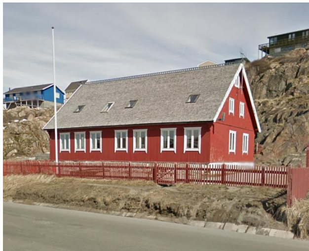
Fig. 2 foto B-17